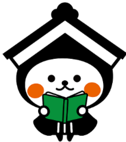
とちぎしますこつときゃらくたー 栃木市マスコットキャラクター