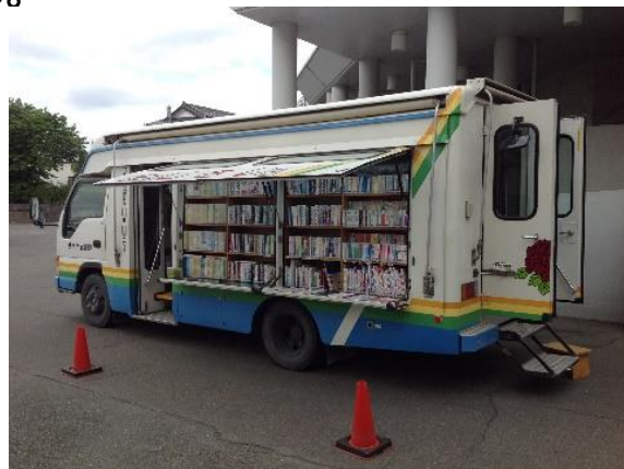
あじさい号 あじさい号